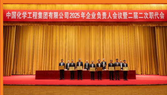
中国化学六化建领导班子获评“四好”领导班子

追则能达，持则可圆。2025年，中国化学六化建将继续高举习近平新时代中国特色社会主义思想伟大旗帜，紧扣中国化学“135”战略，踏时代之浪，扬奋斗之帆，为公司实现“十五五”良好开局，更为中国化学加快建设具有全球竞争力的世界一流企业贡献力量。